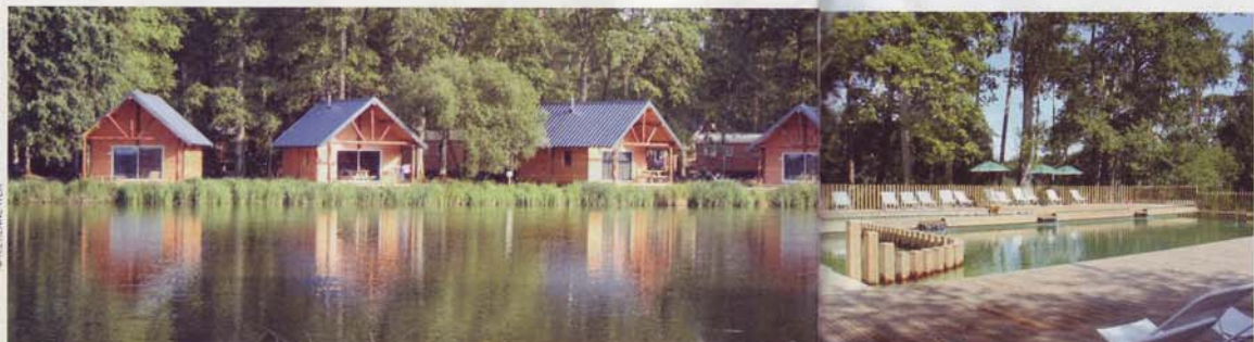
Spécialisé dans le camping chic et proche de la nature, Huttopia propose, à Rambouillet, de séjourner dans des canadiennes et de profiter des plaisirs d'une piscine naturelle. En haut et ci-contre,